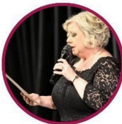
Concetta Patanè Attrice